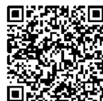
コンビオープン iCombi Pro